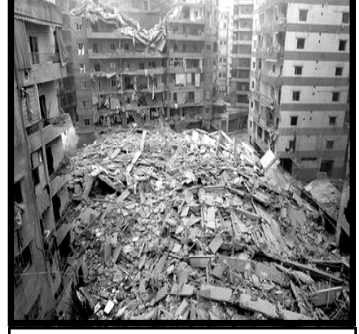
Headquarter of Hizbullah

લેબનાની નાગરીકો વિરૂધ્ધ ઈઝરાઈલના ખુલ્લમ ખુલ્લા આક્રમણ અને અત્યાચારમાં અમેરિકી ગઠબંધન વિશે કોઈને શંકા નથી. આંતર રાષ્ટ્રીય સ્તરે થતી ટીકાઓથી ઈઝરાઈલની બુશે રક્ષા કરી છે. જે લોકોએ ઈઝરાઈલી જુલમ અને અત્યાચાર પર અંકુશ લગાડવાની કોશિશ કરી બુશે તેઓનો રસ્તો બંધ કરી દીધો અને ઈઝરાઈલને બૉબ પૂરા પાડયા જેથી તેઓ લેબનાન પર હજી વધારે બૉબ વર્ષા કરે.